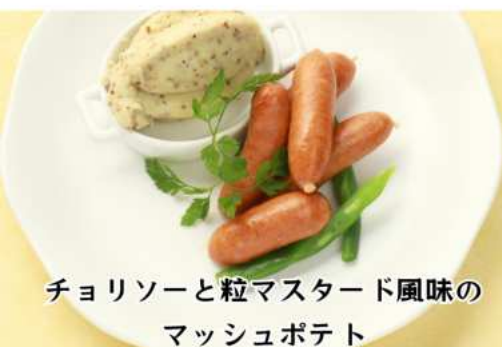
チョリソーと粒マスタード風味の マッシュポテト