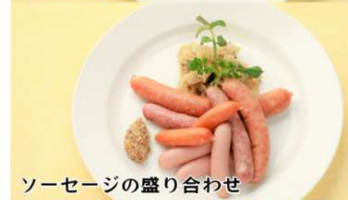
ソーセージの盛り合わせ