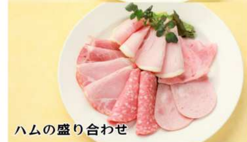
ハムの盛り合わせ