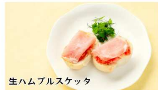
生ハムブルスケッタ