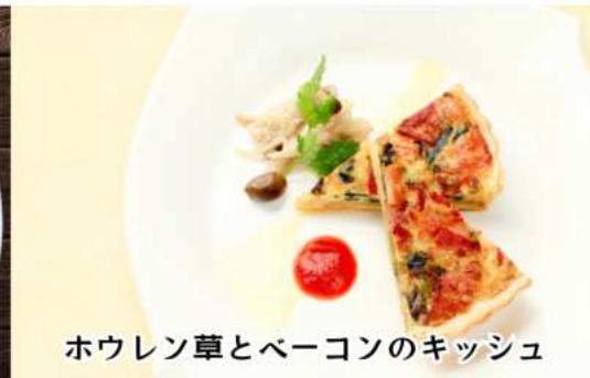
ホウレン草とベーコンのキッシュ