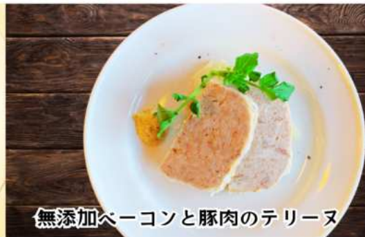
無添加ベーコンと豚肉のテリーヌ