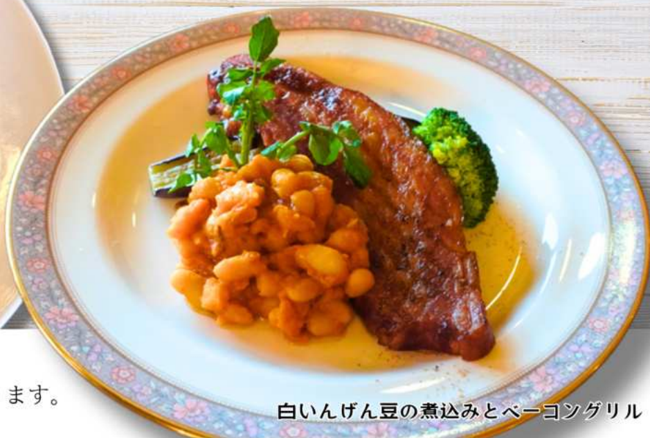
白いんげん豆の煮込みとベーコングリル