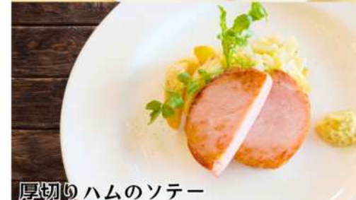
厚切りハムのソテー