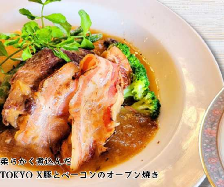
柔らかく煮込んだ