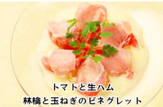
トマトと生ハム 林檎と玉ねぎのビネグレット